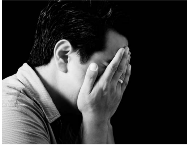
De fleste ved, at kvinder kan blive ramt af fødsels-depressioner, men også mænd kan få problemer.

de til. Jeg magtede ikke at være sammen med min familie.